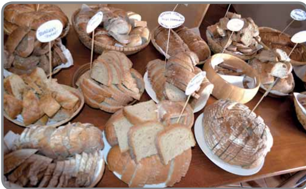
Chleba o dvou kůrkách