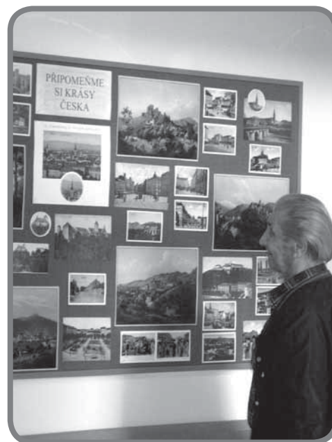
Den otevřených dveří

Domov pro seniory Karolinka se zařadil mezi zařízení, která zavádějí do péče koncept bazální stimulace. Aby byla zajištěna profesionalita péče vycházející z potřeb uživatele, byli v konceptu výškoleni pracovníci z celého terapeutického týmu, tedy pracovníci v přímé péči, zdravotní sestry i specializovaní pracovníci – fyzioterapeut, aktivizační pracovníci. Nedílnou součástí je i zapojení příbuzných. V konceptu bazální stimulace se na klienta pohlíží jako na celistvou osobnost bez ohledu na jeho postižení, tělesný, mentální nebo duševní stav, se všemi jeho tělesnými, psychickými a sociálními potřebami.