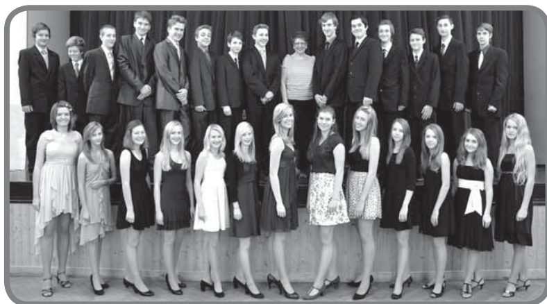
Kurz předtaneční a společenské výchovy žáků 8. a 9. třídy