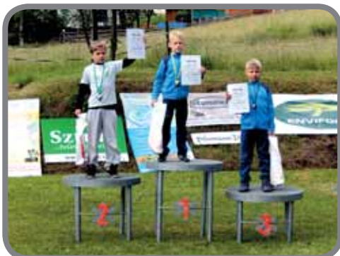
Vítěz Turné čtyř můstků

skoky – 2.místo skoky – 2.místo skoky – 2.místo skoky – 1.místo sev. kombinace – 1.místo skoky – 1.místo sev. kombinace – 2.místo skoky – 3.místo skoky – 1.místo sev. kombinace – 2.místo skoky – 2.místo skoky – 1.místo skoky – 2.místo sev. kombinace – 2.místo skoky – 3.místo skoky – 2.místo sev. kombinace – 2.místo skoky – 1.místo sev. kombinace – 1.místo