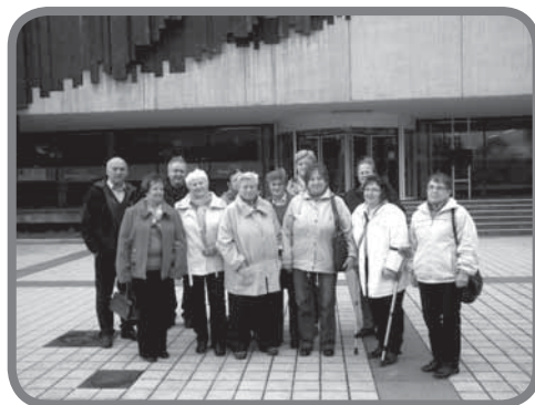
Posluchači U3V před vstupem VŠB-TUO