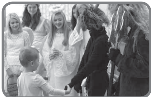
Mikuláš ve škole