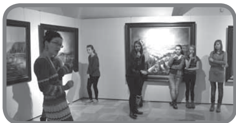
Na výstavě akademického malíře Jiljího Hartingera na vsetínském zámku