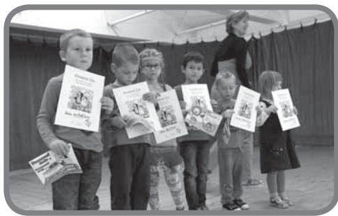
Pěvecká soutěž SEDMIHLÁSEK