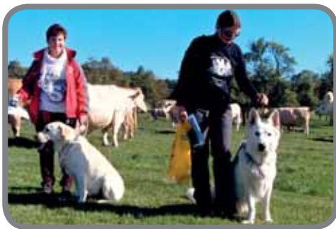
Předání certifikátu vítězným týmům