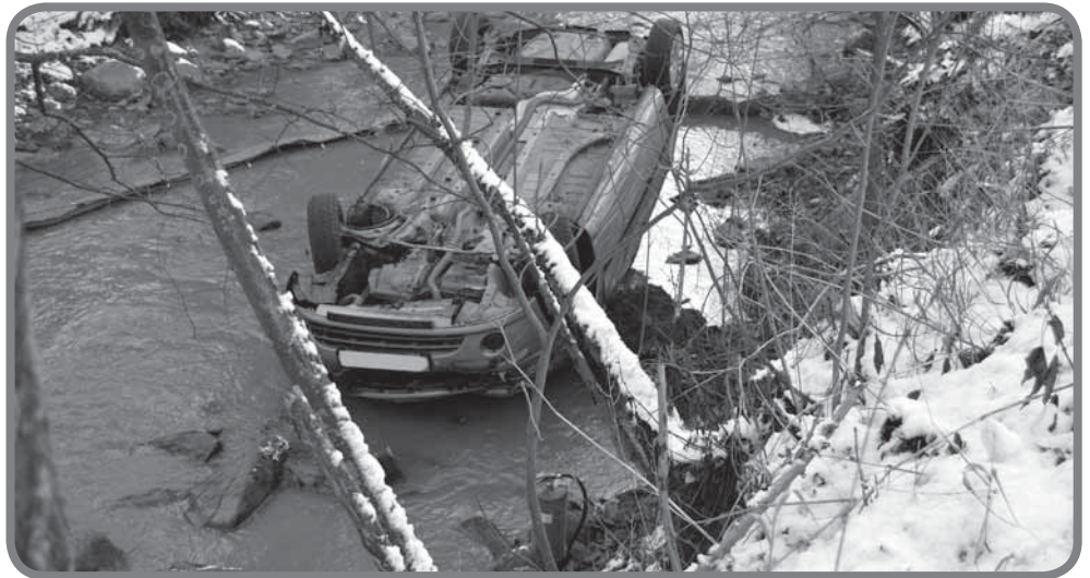
Dopravní nehoda Velké Karlovice