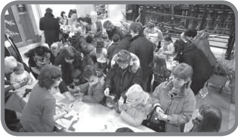
Výroba vánočních ozdob