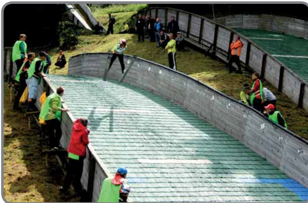
Vítězný skok Turné čtyř můstků