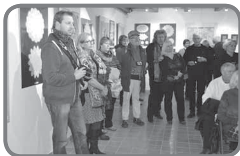
Výstava krajky a dřevorezby