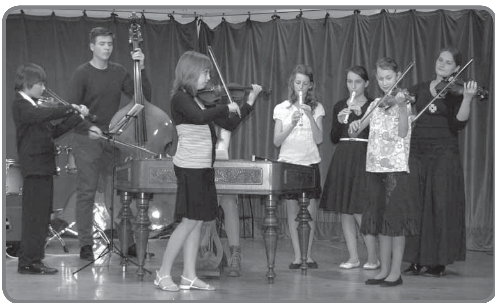
Společný koncert se ZUŠ Bystřice pod Hostýnem

Jakmile jsme zahájili nový školní rok, rozjel se kolotoč nejrůznějších koncertů a vystoupení. Dovolte, abych Vás seznámila s těmi nejdůležitějšími.