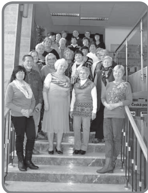
Ukončení kurzu Moderní senior 2014

Budeme pokračovat v tom, co už děláme, takže budou pokračovat kurzy anglického jazyka, kurzy německého jazyka, kurzy trénování paměti. Připravujeme