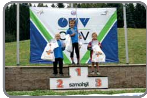
Lomnice nad P. - Malá cena