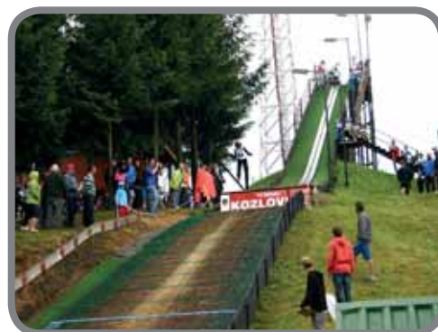
Kozlovic - vítězný skok