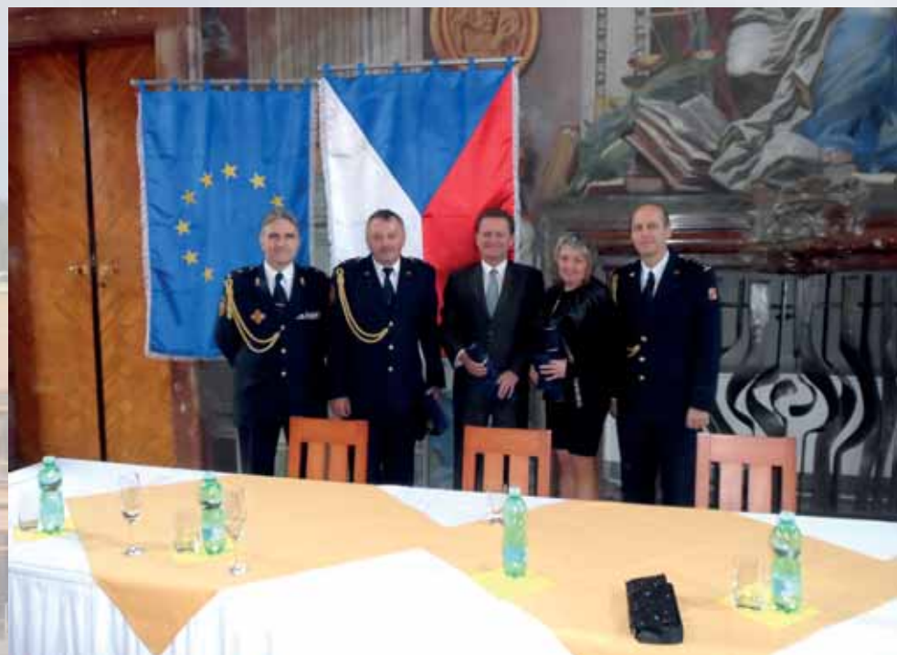
Předání medailí HZS ČR

Vážení spoluobčané, chtěli bychom Vám touto formou poděkovat nejen za sebe, ale i celé Sdružení nezávislých kandidátů „Karolinka“ a Českou stranu sociálně demokratickou za důvěru, kterou jsme dostali ve volbách. Velmi si toho vážíme a je to velká motivace pro práci na nové volební období. Budeme se snažit pracovat tak, abychom Vás neklamali. A proto pokud budete mít jakékoli připomínky, ať už pozi-