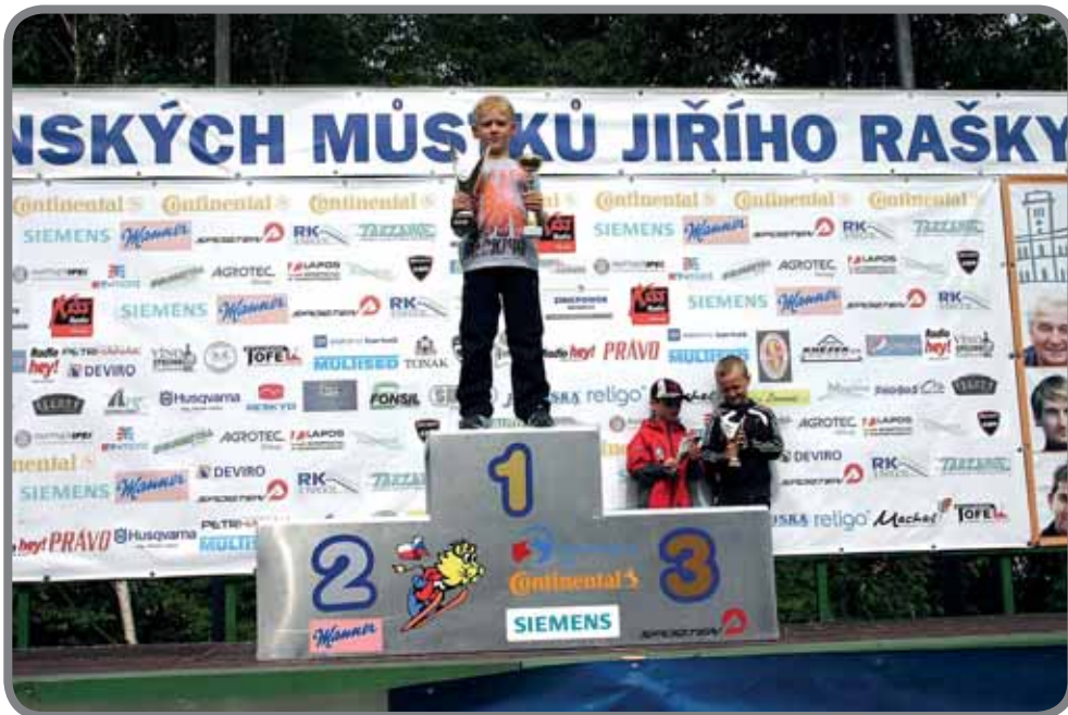
Frenštát - vítěz Beskydského turné

Letní sezónu skokanů otevřelo prestižní Beskydské turné čtyř můstků zde na Moravě. Soutěžilo se na můstcích s umělou hmotou ve Frenštátě, Rožnově, Nýdku a Kozlovicích. Jednotlivé závody se sčítají a po posledním je vyhlášen celkový vítěz.