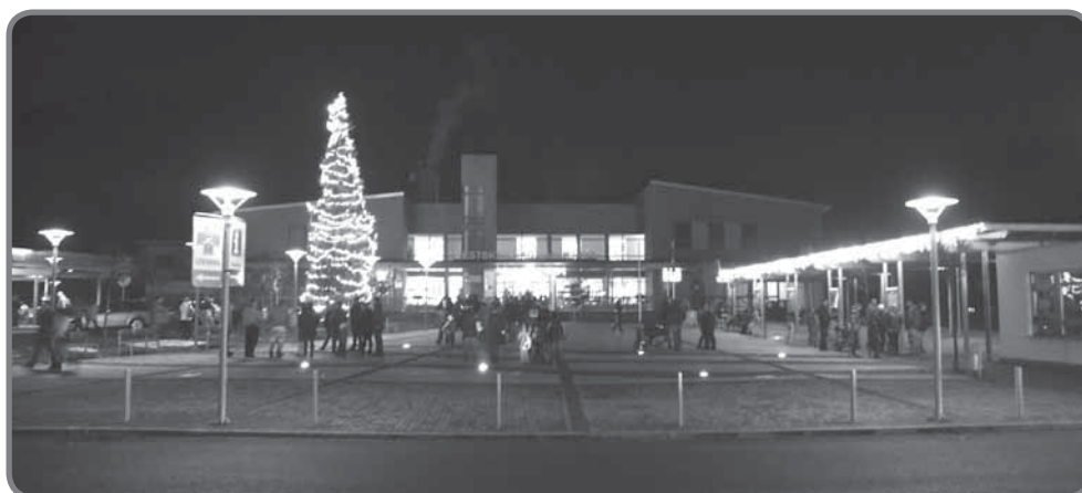
Rozsvícení vánočního stromu