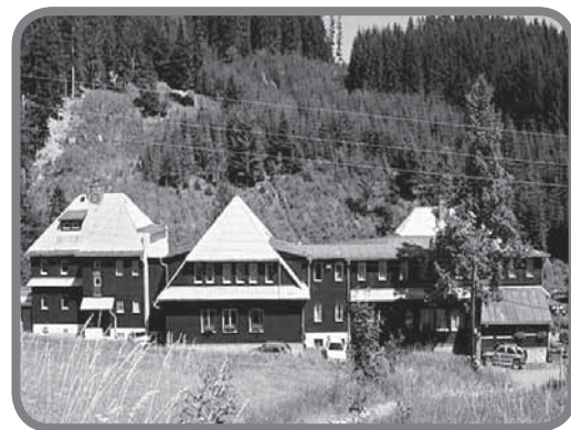
Škola ve Bzovém