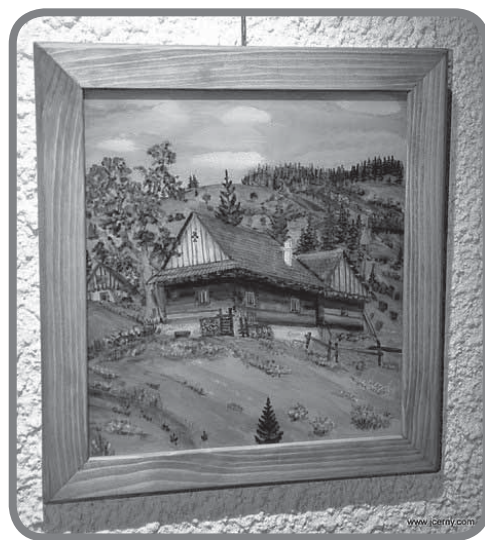
Malba na sklo, J. Dočkalová