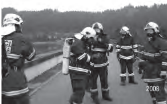
V rámci údržby je nutno jednou za čtvrt roku tzv. vydechovat dýchací přístroje a zajistit jejich opětovné naplnění.

Výjezdová jednotka sboru dobrovolných hasičů Karolinka v letošním roce zasahovala již v jednácti případech, uvedu zásahy až od pátého z nich, jelikož předchozí byly již uvedeny v minulém Zpravodaji.