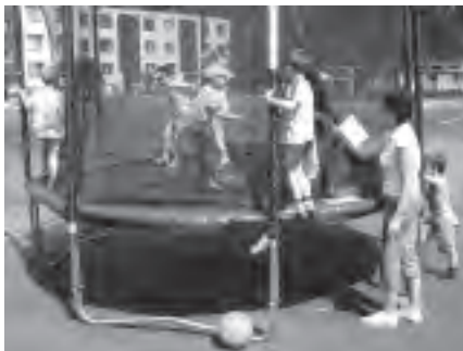
Nějtěžší atrakcí revitalizovaného sídliště Na Nábřežní byla trampolína - než ji zničili vandalové.

ky. Zážitek to byl velmi silný a dobrodružný, ze strany dětí bylo potřeba hodně odvahy a odhodlání. Také následné fotografování dětí bude jednou vzpomínkou na společné chvíli s malými kamarády ve školce.