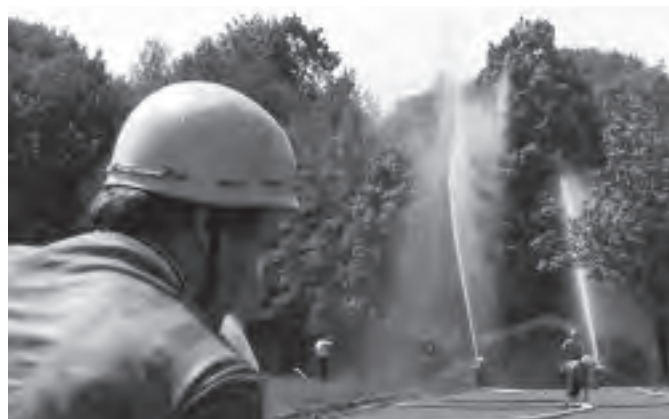
Pohled na hasiče při obvodovém kole požárního sportu ve Zděchově.

Pokud se týká další činnosti Sboru dobrovolných hasičů, jako tradičně uspořádali oslavy Svatého Floriána v hasičském domě u hasičského guláše, piva a harmoniky. Další akce proběhne 19. července 2008, a to soutěž dětí, mužů a žen v požárním sportu na hřišti základní školy. Podrobnosti naleznou čtenáři na pozvánkách v městském zpravodaji, kterými srdečně zveme občany města a jeho návštěvníky.