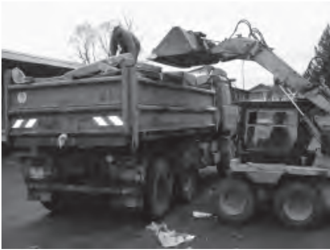
Vytříděný odpad byl rozvezen na skládky a do firem, které se likvidací odpadů zabývají.

Jelikož toto je první vydání Zpravodaje od doby, kdy v našem městě proběhla akce na sběr objemného a nebezpečného odpadu, chci Vás informovat o tom, jak tento jarní sběr probíhal a dotknout se okrajově i obecných pravidel, které by měl každý občan ctít.