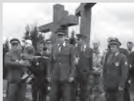
Momentka z pietního aktu na Ztracenci.