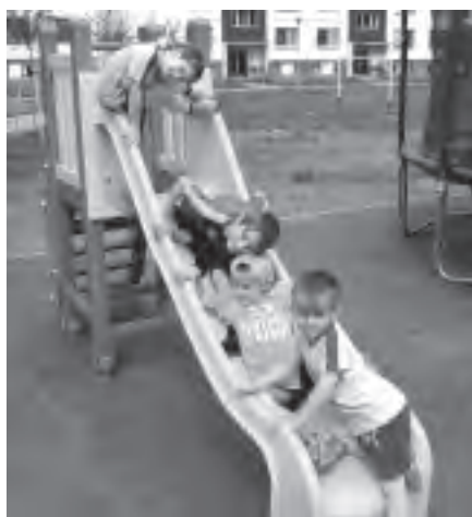
Děti z mateřské školy při vycházce nevynechají ani skluzavku na sídlišti Na Nábřežní.