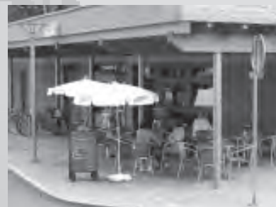
K příjemnému posezení zve nově otevřená kavárna Alfa na Radničním náměstí.

Na vaši návštěvu se těší personál kavárny.