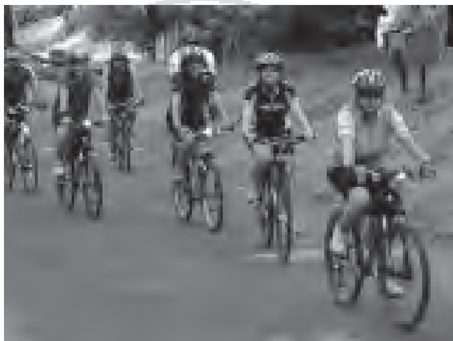
Tuto skupinu cykloturistů jsme zachytili kousek pod Ratkovským šenkem.

(z podkladů mikroregionu Valašsko – Horní Vsacko)