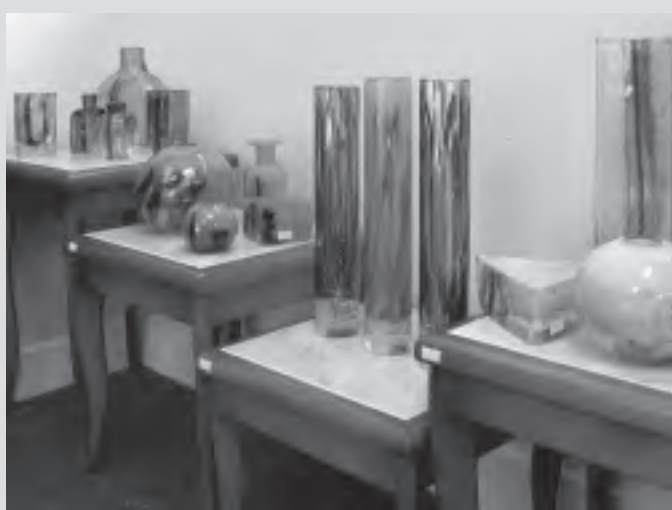
Několik překrásných artefaktů, které můžete najít v galerii Charlotta.