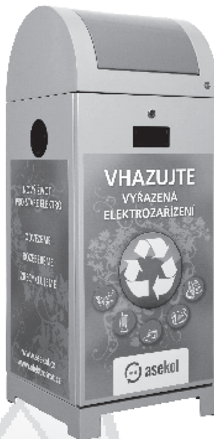
Takto vypadá E-box na vysloužilá malá elektrozařízení.