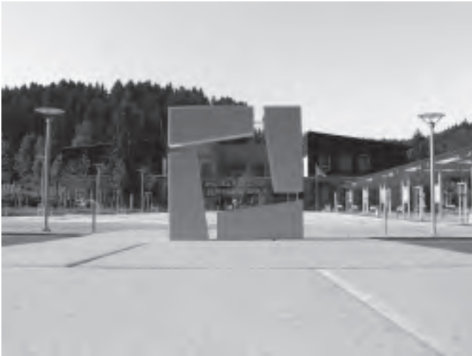
Pohled na nové náměstí přes plaketu s oceněním Stavba roku.

Za třešničku na dortu je pak možno považovat další ocenění Radničního náměstí, a tím je prestižní Cena Syndikátu novinářů ČR Zlínského kraje, který rovněž naše náměstí ocenil jako stavbu roku 2007 Zlínského kraje.