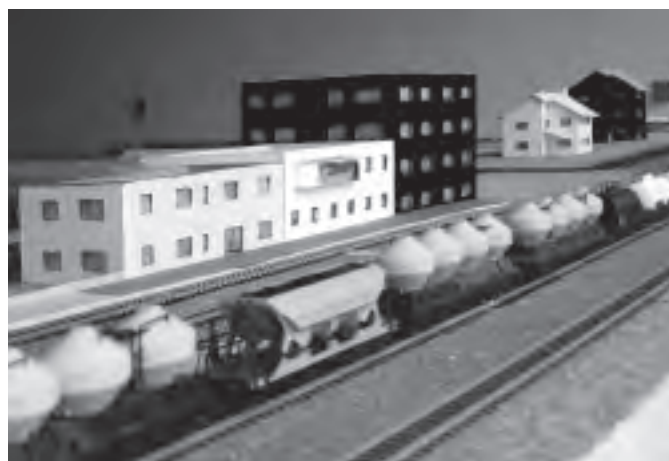
Část modelového kolejiště, které v průběhu let zhotovili členové modelářského kroužku základní školy pod vedením Jaroslava Adamce.

Teď bych rád uvedl několik údajů k přijímacím řízením žáků devátých tříd. Ve školním roce 2007 – 2008 ukončí povinnou školní docházku 33 žáků devátých tříd a jeden žák z třídy osmé. Z tohoto počtu bylo šest žáků přijato ke studiu na gymnáziích, a to v Rožnově pod Radhoštěm, Vsetíně a Zlíně. Pět děvčat se rozhodlo pro studium na školách zaměřených na zdravotnictví, další dvě pro studium na Obchodní akademii ve Valašském Meziříčí. Obory automechanik, autotronik, zedník, tesař, obráběč kovů bude studovat 6 chlapců na Střední odborné škole Josefa Sousedíka ve Vsetíně. Zbývající žáci zvolili obory na různých středních průmyslových školách ve Zlínském kraji. Všichni žáci byli při přijímacím řízení úspěšní.