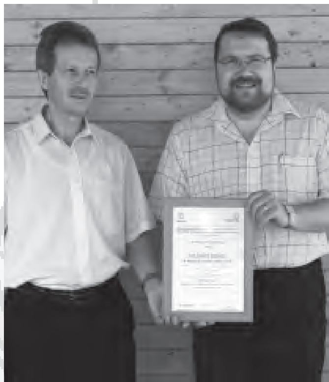
Starosta a místostarosta Karolinky s plaketou Hlavní cena v soutěži Stavba roku 2007.