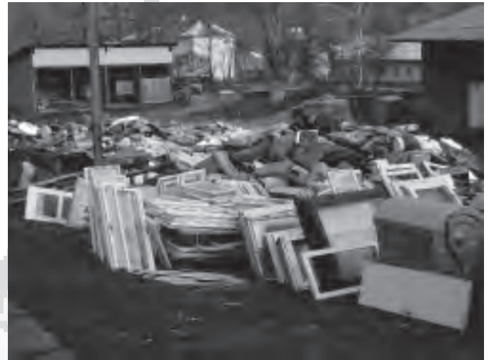
V době jarního sběru odpadů to v areálu bytového podniku vypadalo opravdu velmi zajímavě.

Všichni jistě pochopí, že tyto prostředky je nutno investovat. Ale mnohdy jsme sami proti sobě. Uvedu jeden markantní příklad. Již v některém z předešlých Zpravodajů jsem Vás informoval o tom, jaký je rozdíl mezi elektroodpadem a tak zvaným zpětným odběrem elektromateriálů a spotřebičů. Jen krátce zopakuji. Neporušené, i když opotřebované lednice, televizory, počítače atd., jsou brány jako zpětný odběr a jsou odebírány zdarma. Jestliže však „domácí kutilové“ z lednice odmontují motor, z televizoru některé jeho součásti a potom nám to dovezou na dvůr, je to považováno za elektroodpad a za jeho likvidaci se platí. A to nemalé částky. Například za likvidaci jedné tuny takto neúplných spotřebičů zaplatíme téměř pět tisíc korun a ještě dopravu na místo likvidace. A musím upozornit, že v Karolince (a asi nejen v Karolince) je těch neúplných spotřebičů drtivá většina. Takže za ně platíme vlastně dvakrát. Protože v ceně při jejich koupi platíte tak zvaný příplatek za likvidaci a potom po letech, když se věci zbavujete, platíme všichni za likvidaci znovu.