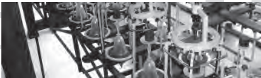
Detail rekonstruovaného sklářského pantografu.