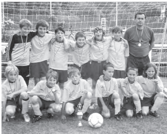
Úspěšná starší příprava FC Velké Karlovice + Karolinka B

Starší příprava fotbalistů FC Velké Karlovice a Karolinka B má za sebou velmi úspěšnou sezonu podzim 2005 – jaro 2006, když svoji skupinu vyhráli s velkým náskokem před největším soupeřem z Halenkova.