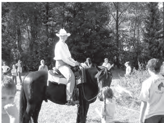
Westernové předvádění při dětském dni