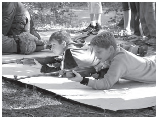
Neodolatelná atrakce pro chlapce - střílba ze vzduchovky, kterou pro ně připravili myslivci