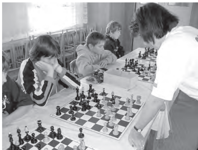
Kdo by si nechtěl vyzkoušet soubor se šachovou mistryní