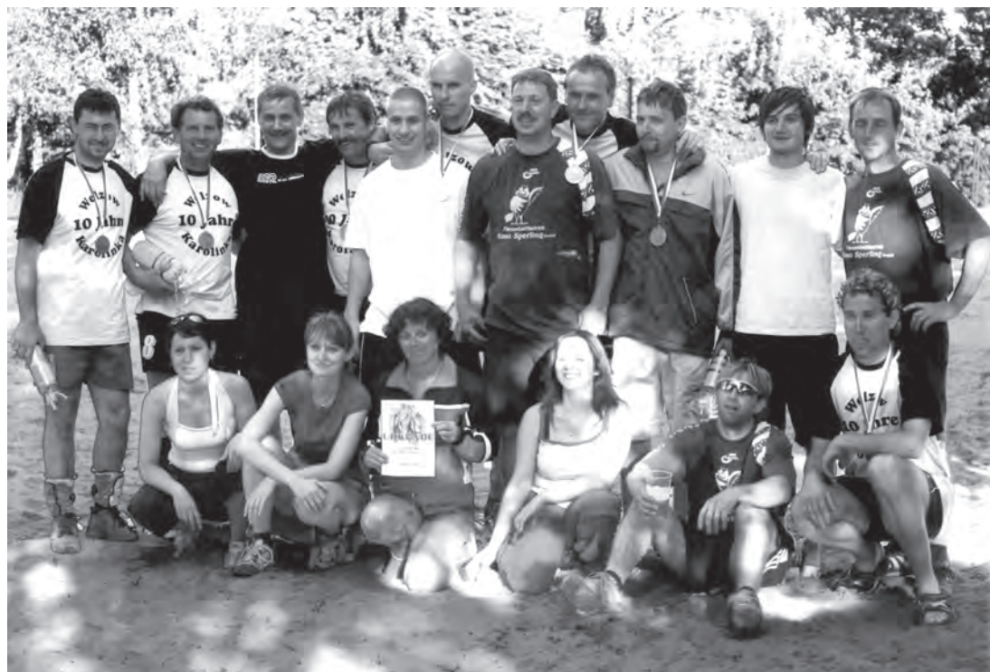
Fotografie z červnového úspěšného turnaje v německém Welzovu, kde naši volejbalisté obsadili první místo

V kategorii mužů se utkalo třináct mužstev, která byla rozdělena do tří základních skupin. Celkovým vítězem se stal favorizovaný celek Pinchechoto, tvořený loni ještě druholigovými volejbalisty Nového Jičína. Ve finále si po boji poradil s meziříčskými Kozáky, kteří obhájili titul. Třetí místo získali vsetínští Pavúci, čtvrtý byl tým Hodonína.