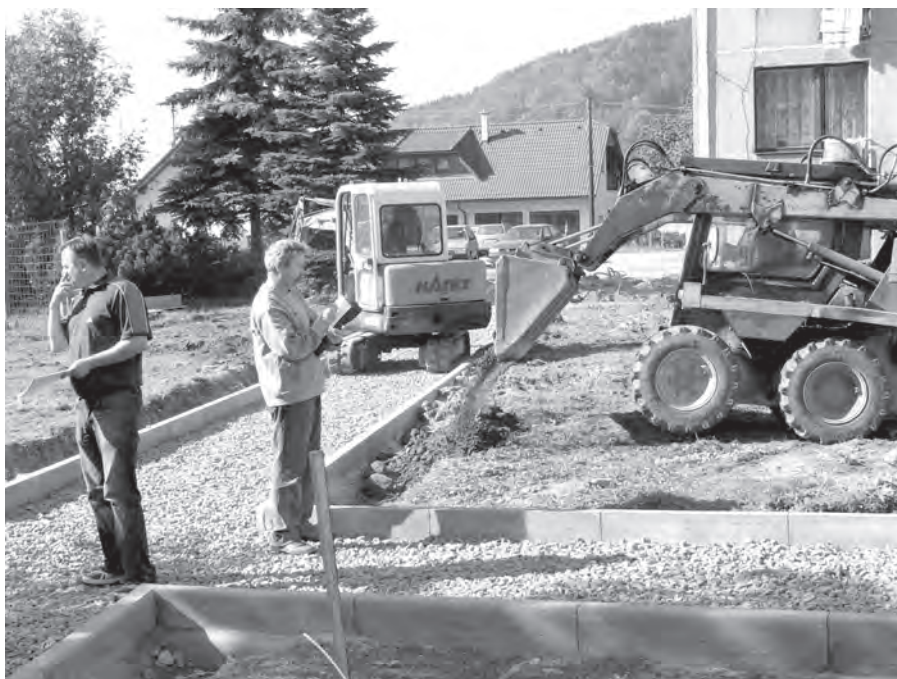
Čiň stavební ruch vládne v těchto dnech při regeneraci sídliště Na Oboře

Vážení občané, dovolte mi, abych na konci svého volebního období ve zkratce zhodnotil působení městského zastupitelstva v tomto volebním období. Tady je stručná bilance toho, co se nám dle mého názoru povedlo.