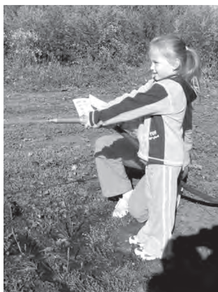
Budoucnost hasičského sportu

Městský bytový podnik Karolinka se svojí činností aktivně podílel na zlepšení životního prostředí ve městě a zkvalitňování servisu pro občany v oblastech bydlení, vytápění domácností, zásobování vodou, údržbě komunikací a městské zeleně, sběru komunálního a velkoobjemového odpadu apod. Iniciativně se podílel na úspěšné realizaci investičních akcí ve městě a vlastnímu pracovníky, případně za pomoci externích firem provedl řadu akcí na objektech, spravovaných městem. U bytového fondu se jednalo o opravy fasád, střech a vnitřního vybavení v městských bytech a