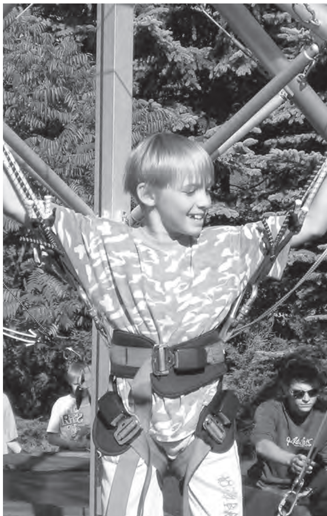
Atrake, na kterou se při dětském dni stály fronty - bungee trampolína