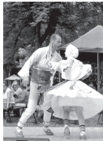
Roztánčený pár ze vsetínských Jasének na letošním sklářském jarmarku

Co se týká kulturního vyžití ve městě Karolinka, podařilo se nám uspořádat již čtvrtý ročník oblíbené akce pro děti Kdo si hraje nezlobí a troufám si říct, že jsme vytvořili tradici, která bude pokračovat i v budoucnu. Přes útlum sklářské výroby v Karolince se podařilo zachovat tradici sklářského jarmarku, který