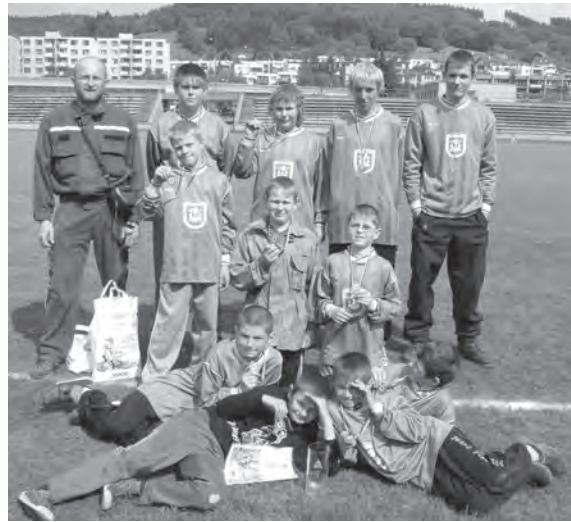
Bronzové medaile mladých hasičů na okresní soutěži Plamen ve Vsetíně

Velkého úspěchu dosáhli mladí karolinští hasiči,