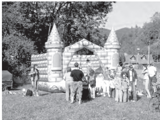
Kdo by si nechtěl vyzkoušet soubor se šachovou mistryni

Dětská návštěvníci s velkým nadšením využili skákacího hradu, bungee trampolíny, motorek, motokár pro děti a také si vyzkoušeli jízdu na koních. Dále shlédli seskok paraglidistů, vystoupení studentského rockového souboru Svatý pluk z Uherského Hradiště, ukázkou tanců školy stepu z Blanska, vystoupení skupiny historického šermu Valmont, předvedení westernové jízdy, ukázkou tanců dětí z dětského domova